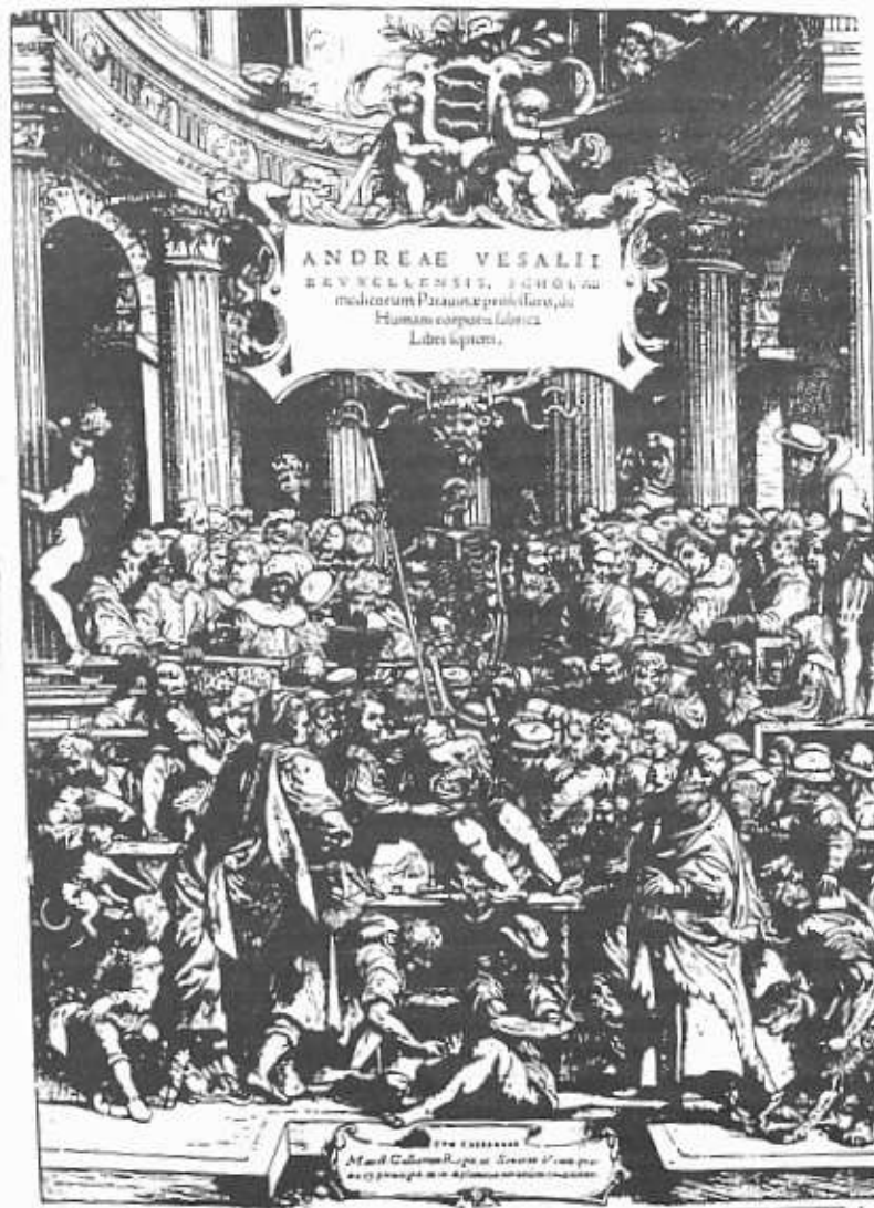
Andreas Vesalius sezirt einen Körper im „anatomischen Theater“, einem Hortsaal der Universität zu Padua; Titelbild seines Werkes „De humani corporis fabrica“. Ein Original der Zweit Auflage von 1555 wird jetzt versteigert.