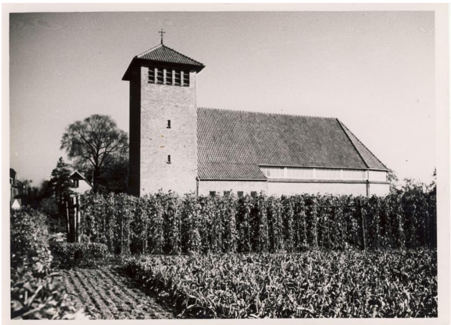
Die Gnadenkirche in Wesel-Fusternberg in den frühen 1950-er Jahren.

Auch eine der beiden Glocken der ehemaligen Mathena-Kirche, die durch eine Verkettung von Umständen erhalten blieb, wurde in den Turm der Gnadenkirche aufgenommen. Diese Glocke sollte im 2. Weltkrieg zur Waffenproduktion eingeschmolzen werden und war auf dem Glockenfriedhof in Ilsenburg (Harz) eingelagert worden. Glücklicherweise war