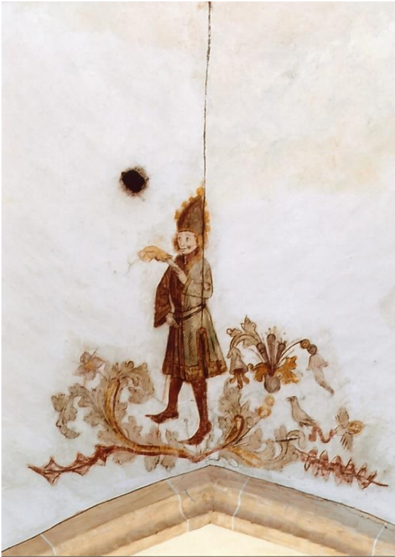
Kinderbischof. Deckengemälde in der Martinikerk in Groningen, Niederlande.

für seine standesgemäße Ausstattung als „Bischof“ mit Pantrock, Hose, Riemen und einer roten Mütze (zur Kleidung siehe Bild) trug die Stadt, die zudem einen Sack mit Äpfeln im Rathaus bereit hielt zur Beschenkung der Kinder.