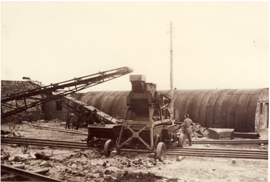
Die Trümmermühle zum Bau der Gnadenkirche im Jahr 1949.

Christen in verschiedenen Orten Deutschlands umgesetzt werden konnte. Der Schutt der zerbombten Mathena-Kirche wurde von Gemeindegliedern auf Pferdekarren zum Fusternberg gekarrt und dort in einer Trümmermühle gemahlen. Aus den Steinbrocken wurden dann unter Zugabe von Zement neue Steine geformt, aus denen die Wände und der Turm der Gnadenkirche errichtet wurden.