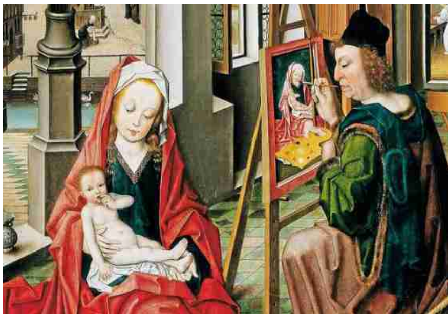
Derick Baegert "Lukasmadonna" (1480/1500) - der Evangelist Lukas malt Maria mit dem Jesuskind -

Gesegnete Weihnachten und ein glückliches Neues Jahr 2013